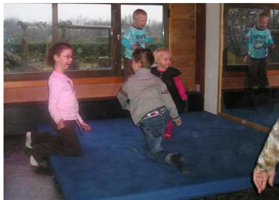
Disco lys og højt musik

Efter vi havde indtaget et godt måltid fra den fælles buffet som startede med gammeldags risengrød med kanel og smørklat gik vi over til frikadeller, ribbensteg, tærter, lasagne og diverse salater, ost godt brød osv.osv. Kaffen manglede heller ikke med æbleskiver og flere slags hjemmebagte kager.