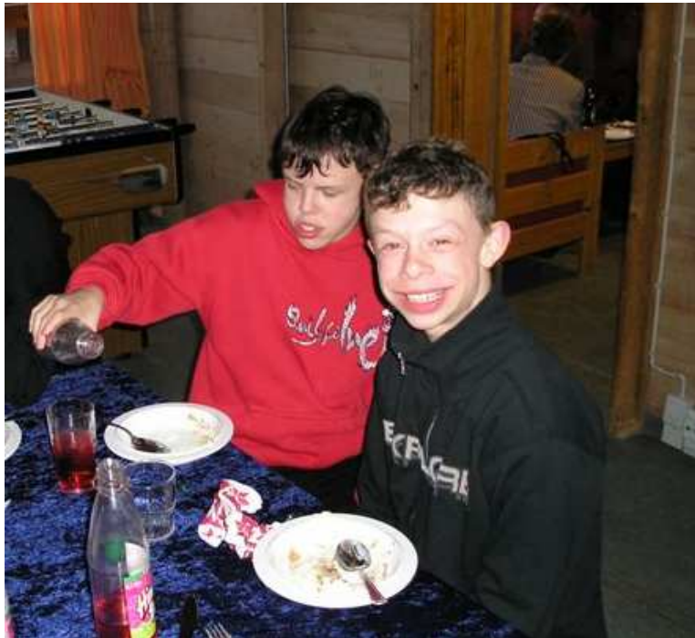
Uhm, risengrød og rød sodavand det er sagen