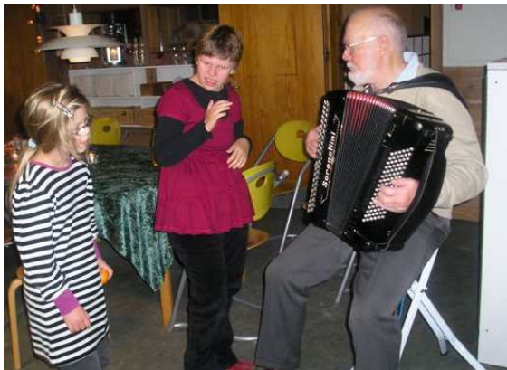
Sang og musik skal der til

Vi takker for en dejlig dag, og fryder os over at se så mange glade børn, unge og voksne samlet om et fælles mål, nemlig at hygge, noget vi gjorde tilfulde.